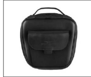
BORSA BAULETTO SEMIRIGIDA CUIOIO REAR SEMI RIGID BAG ***** COD. 2B003372

Realizzata con una perfetta combinazione tra pelle e tessuto tecnico, permette di alloggiare sul portapacchi posteriore un bagaglio sufficiente a vivere un'esperienza di viaggio intensa e prolungata. This semi-rigid rear bag mounts easily to the rear rack and is made of a perfect balance of leather and technical textile panels.