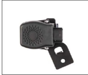
ANTIFURTO ELETTRONICO ANTITHEFT SYSTEM ..... COD. 606423M COD. 2S000978 kit installazione / installation kit

Presse USB fornita di supporto dedicato per installazione nel sottosella, per la ricarica dei supporti elettronici, non consente il dialogo con gli apparati elettronici del mezzo. USB socket with bracket for installation under the saddle, to recharge the electronic media, does not allow dialogue with the electronic devices of the vehicle.