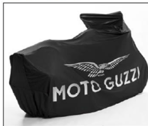
TELO COPRIMOTO "EAGLE" "EAGLE" BIKE COVER ..... COD. 606028M0001

Telo su misura da interno per la protezione dalla polvere da utilizzare durante le soste in garage della moto. È realizzato in un tessuto elasticizzato con grafica speciale. Tailor-made motorcycle cover for inside use to protect against dust, intended for use during long periods of storing the bike in a garage. It is made of stretch fabric with special graphics.