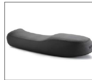
SELLA COMFORT GEL COMFORT GEL SADDLE ***** COD. B063597

Sella sportiva monoposto, caratterizzata da imbottiture elettroscaldate e cuscini. Logo Moto Guzzi ricamato. Single-seat sport saddle with electro-welded and stitched padding. Moto Guzzi Logo embroidered.