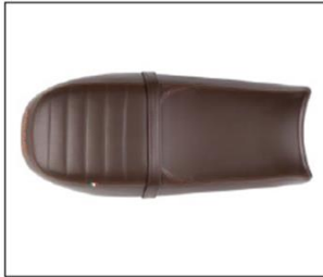
SELLA MARRONE PREMIUM BRAWN PREMIUM SADDLE ***** COD. 2S000922

La sella premium rende V7 un veicolo davvero esclusivo ed unico con un livello di finiture e qualità dei materiali di categoria superiore. This saddle gives V7 a unique and exclusive status thanks to precious finishing and superior materials.