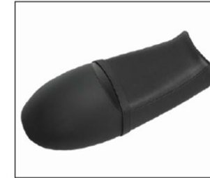
SELLA MONOPOSTO SINGLE-SEAT SADDLE ***** COD. 606124M

Sella con seduta ridotta rispetto a quella di serie montata sulla moto. Perfetta per guidare in una posizione più aerodinamica e anche per permetterti, quando serve, di portare una persona. Logo Moto Guzzi ricamato. Smaller saddle for your V7 than the one that is factory mounted on the bike. Perfect for riding in a more aerodynamic position as well as for allowing you to ride two-up when necessary. Moto Guzzi Logo embroidered