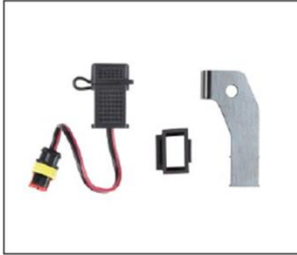
KIT INSTALLAZIONE PRESA USB USB SOCKET INSTALLATION KIT ..... COD. 2S000983

Presse USB fornita di supporto dedicato per installazione nel sottosella, per la ricarica dei supporti elettronici, non consente il dialogo con gli apparati elettronici del mezzo. USB socket with bracket for installation under the saddle, to recharge the electronic media, does not allow dialogue with the electronic devices of the vehicle.