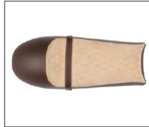
SELLA LADY BIKE BRAWN PREMIUM SADDLE ***** COD. 2S000921

La sella premium rende V7 un veicolo davvero esclusivo ed unico con un livello di finiture e qualità dei materiali di categoria superiore. This saddle gives V7 a unique and exclusive status thanks to precious finishing and superior materials.