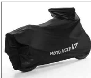
TELO COPRIMOTO V7 V7 BIKE COVER ..... COD. 895729

Telo su misura da interno per la protezione dalla polvere da utilizzare durante le soste in garage della moto. È realizzato in un tessuto elasticizzato con grafica speciale. Tailor-made motorcycle cover for inside use to protect against dust, intended for use during long periods of storing the bike in a garage. It is made of stretch fabric with special graphics.