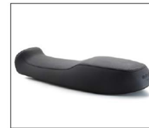
SELLA RIBASSATA COMFORT GEL LOWER COMFORT GEL SADDLE ***** COD. B063598

Sella biposto con inserti in gel nelle zone pilota e passeggero. Oltre al comfort, offre un maggior appoggio a terra grazie al diverso disegno dello schiumato. Logo "Comfort Gel" punzonato. Two seat saddle with gel inserts in the driver and passenger area. Besides comfort, it offers better contact with ground due to the different design of the foamed structure. Punched "Comfort Gel" logo.