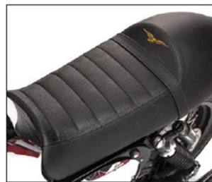
SELLA MONOPOSTO PREMIUM PREMIUM SINGLE-SEAT SADDLE ***** COD. 2S000260

Sella trapuntata per la tua V7 con seduta un po' più ridotta rispetto a quella di serie montata sulla moto. Perfetta per guidare in una posizione più aerodinamica e anche per permetterti, quando serve, di portare una persona. Logo Moto Guzzi ricamato. Smaller saddle for your V7 than the one that is factory mounted on the bike. Perfect for riding in a more aerodynamic position as well as for allowing you to ride two-up when necessary. Moto Guzzi Logo embroidered.