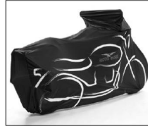
TELO COPRIMOTO "SHAPE" "SHAPE" BIKE COVER ..... COD. 606028M0002

Protegge la tua moto grazie alla centralina compatta e tecnologicamente avanzata. Permette una facile e discreta installazione ed è dotata di telecomando. Il sistema è autoalimentato ed ha un assorbimento energetico minimo. Necessita kit di installazione. This electronic antitheft system protect your vehicle. The electronic box is very small and packed with advanced technology, and allow an easy and invisible installation. This system has a battery backup and a very low power drain. Includes a remote control, need mounting kit.