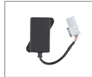
GUZZI MULTIMEDIA PLATFORM ***** COD. 606522M COD. 25000912 kit installazione / installation kit

Un portapacchi di dimensioni ridotte in metallo verniciato nero. È pensato per agganciarci la borsa porta attrezzi, ma è perfetto anche per il tuo prossimo viaggio. Può essere montato solo con i codici 25000152; 25000147; 25000180. A small baggage rack in black painted metal. It is designed to attach the tool bag, but is also perfect for your next trip. Can be installed only with 25000152; 25000147; 25000180.