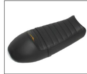
SELLA AD UN POSTO E MEZZO ONE AND A HALF SEAT SADDLE ***** COD. 2S000285

La sella Lady utilizza materiali design e finiture davvero unici, che ne sottolineano il tocco femminile. Materials, design and finishing of this saddle are giving V7 an unmistakable Lady style.