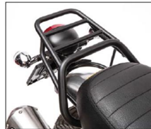
PORTAPACCHI PICCOLO VERNICIATO NERO SMALL LUGGAGE RACK ***** COD. 25000256

Il portapacchi posteriore, con finitura nera, è il supporto ideale per un bagaglio compatto o per il bauletto posteriore dedicato a V7. This black rear rack improve the elegant shape of V7 and is needed to support the rear top box.