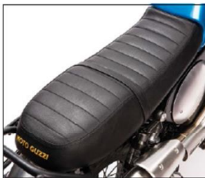
SELLA CON IMBOTTITURE PADDED SADDLE ***** COD. 2S000262

Sella sportiva monoposto, basata sulla linea della classica V7 Café. Single-seat sport saddle based on the classic V7 Café line.